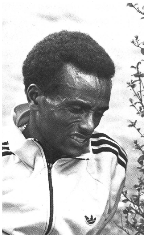
Junior éthiopien: l'apprentissage de la souffrance.