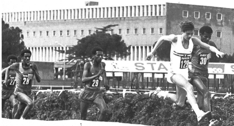
Pour la première fois, l'escadron vert chez les juniors aussi: vainqueur par Gelawa (no 28) et par équipes.