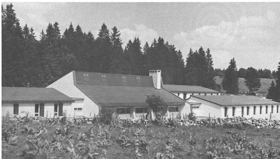
Le centre sportif des Cernets-Verrières.

Selon les statistiques de l'année 1981, les moniteurs J + S du canton de Neuchâtel ont organisé 386 cours et ils ont dispensé leur enseignement à 8710 participants (2946 filles et 5764 garçons). Il est pourtant difficile de tirer des conclusions, car cette année inaugurerait l'ère de la nouvelle conception J + S. Nous pouvons tout de même constater qu'il y a eu une diminution des camps scolaires (passagère peut-être) compensée par une augmentation des groupements sportifs, en particulier ceux de basketball, de volleyball et, surtout, de judo et de tennis. Il faut espérer que cette dernière tendance se poursuive et que la