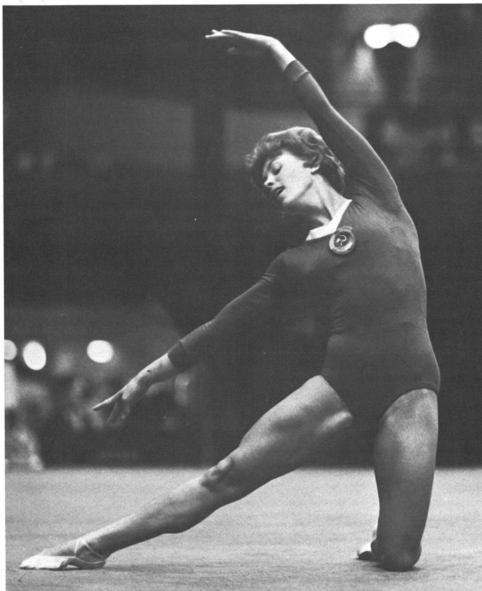
Larissa Latynina (Championnat du monde de Prague 1962)