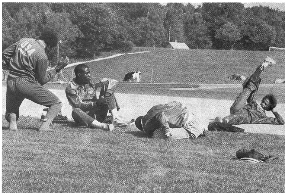
Manning, Lewis & Co: décontraction à l'américaine.

celui qui ira plus loin que tout autre dans cette discipline.» Il ne songe qu'à faire mieux que Beamon (8,90 m) et il y parviendra un jour que,