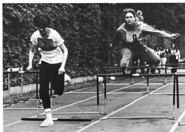
Entraînement technique de la course haies