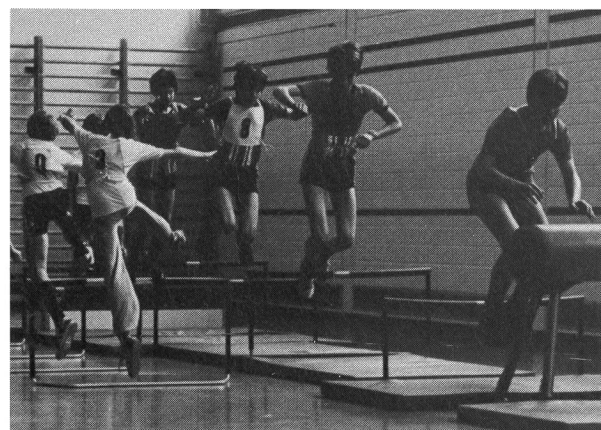
Entraînement de détente