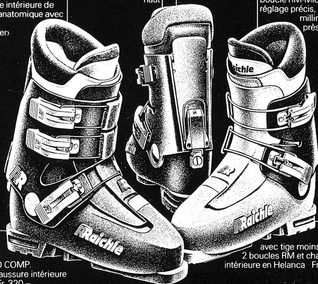
STRATO COMP. avec chaussure intérieure en cuir Fr. 320.-

Boucle RM-Micro au réglage précis, au millimètre près!