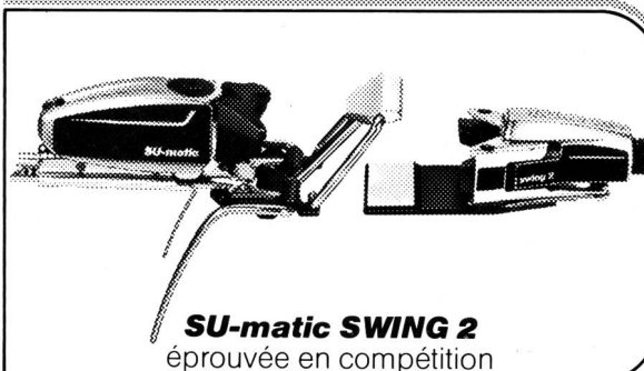
SU-matic SWING 2 éprouvée en compétition