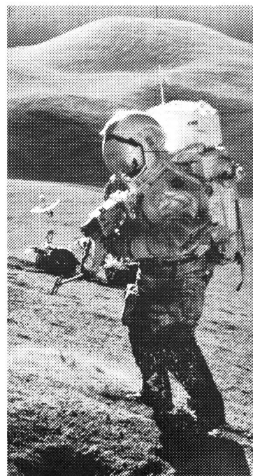
145 0022 - Seamaster, Speedmaster professional, remontage manuel, étanche.