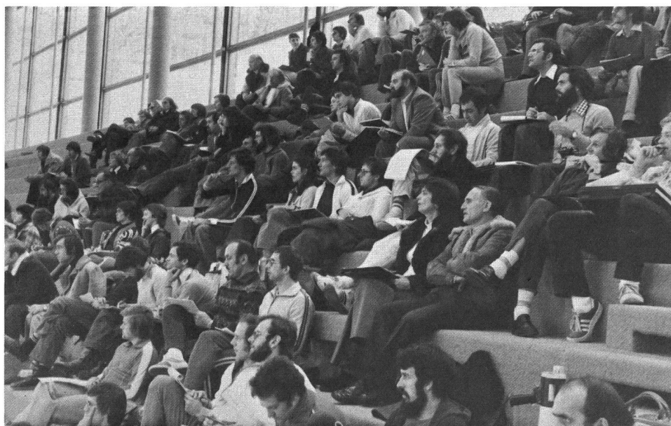
Une partie de nos moniteurs durant une démonstration de la classe d'application

Mais de temps à autre on peut voir également du volleyball pratiqué comme sport populaire. Les journaux, eux, écrivent beaucoup sur le volleyball. Il y a même des articles dans le «Neues Deutschland» (nouvelle Allemagne) et l'on a essayé, par des séries d'articles, d'expliquer aux lecteurs les règles et l'idée du volleyball.