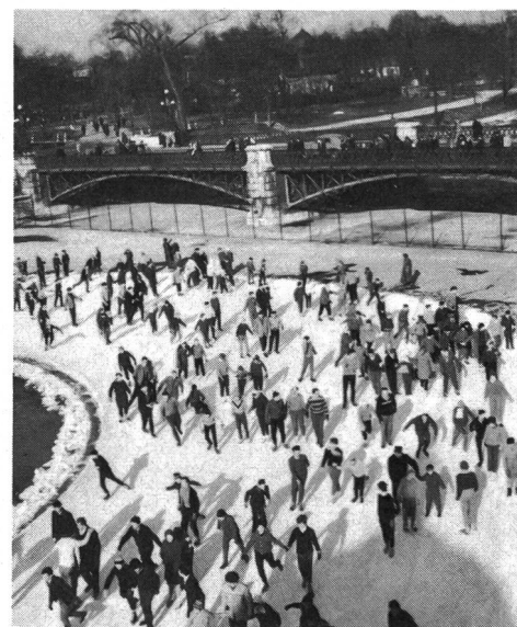
La patinoire dans le parc de Budapest