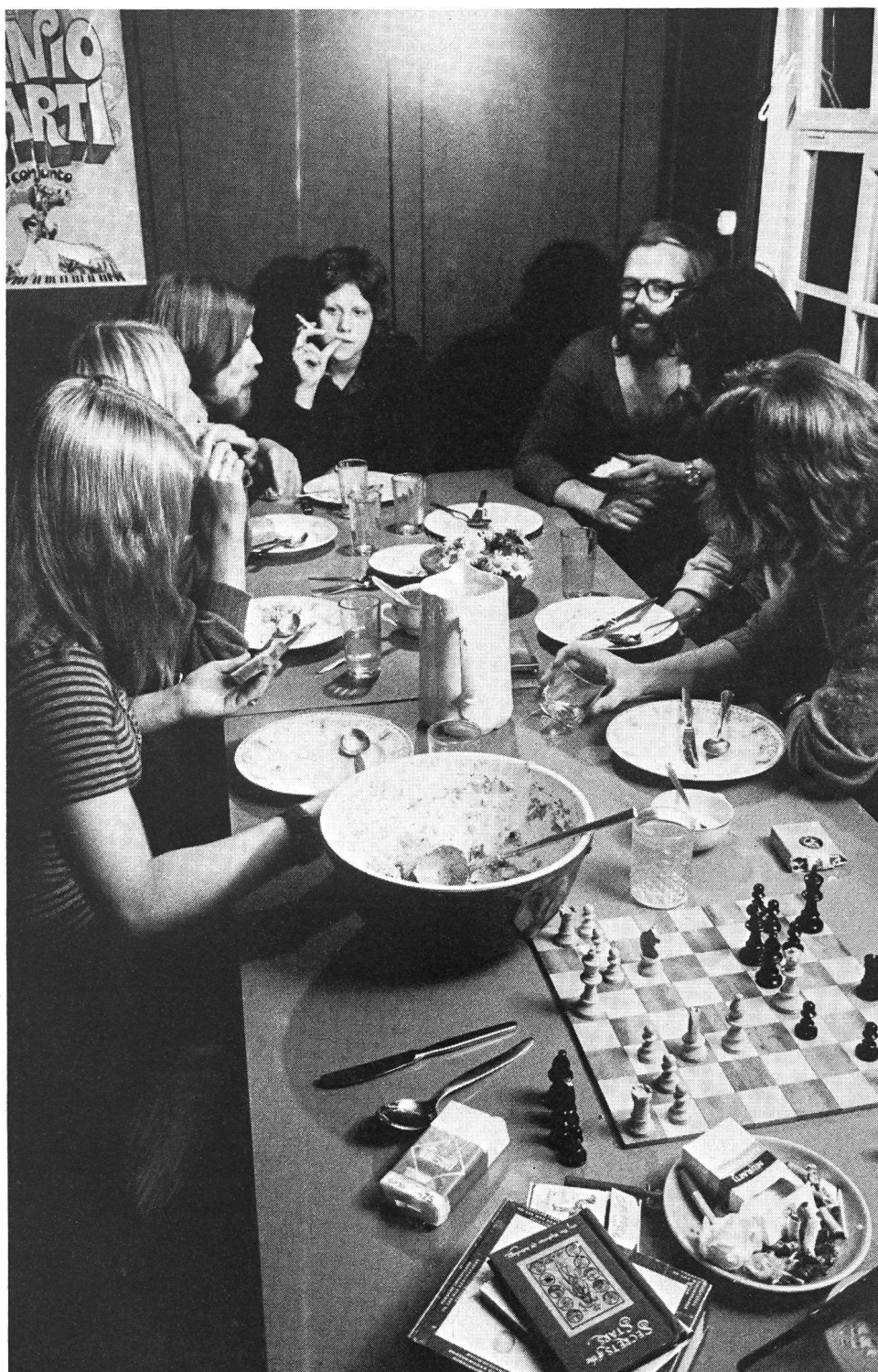
« La réintégration des toxicomanes ... dans le ,monde du travail'. »

D'autres propositions concernaient l'encouragement de la formation politique, des organisations et institutions de jeunesse, de l'information de la jeunesse et sur la jeunesse, ainsi que les contacts nationaux et internationaux des jeunes. On attribua une importance parti-