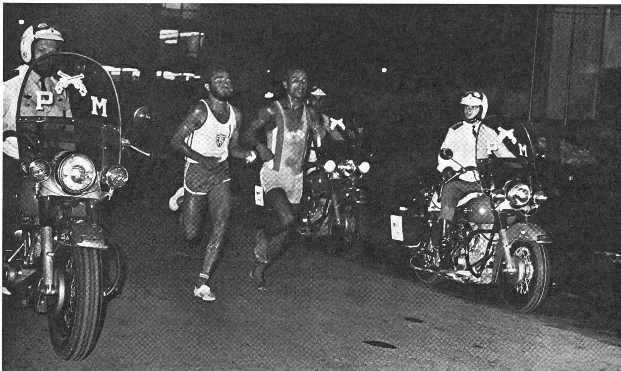
«En soi, nos pieds sont faits pour courir sans chaussures...» mais sur un sol naturel!

Tout cela vaut donc pour les coureurs mais surtout pour les femmes qui courent. Car, plus que les hommes elles ont l'habitude de porter des chaussures à talon épais.