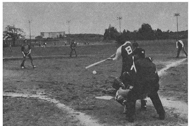
Balle molle! Dérivé du base-ball, jeu très populaire dans les sports de plein air.

Le Haut Commissariat à la Jeunesse, aux Loisirs et aux Sports (HCJLS) créé en 1968, marque cette préoccupation des pouvoirs publics d'assurer des responsabilités étendues et plus complètes dans les différents secteurs du sport.