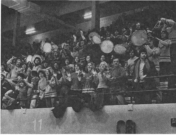
Les foules québécoises! Match de hockey sur glace entre universités. Le hockey sur glace: fascination de la jeunesse.

érigé en «symbole de la survivance de la race canadienne-française», révèle un rapport sur le sport québécois datant de 1970.