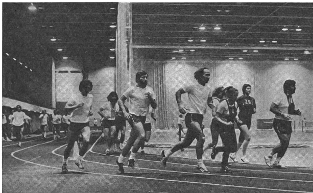
Jogging sur la piste d'athlétisme couverte de l'Université Laval.

4000 participants de 19 à 65 ans à son cours de Condition physique dirigé, et sa piste d'athlétisme couverte recevait plus de 22 300 adeptes du jogging durant l'automne 1974 et l'hiver 1975.