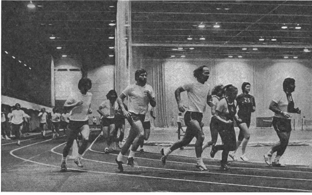
Jogging sur la piste d'athlétisme couverte de l'Université Laval.

4000 participants de 19 à 65 ans à son cours de Condition physique dirigé, et sa piste d'athlétisme couverte recevait plus de 22 300 adeptes du jogging durant l'automne 1974 et l'hiver 1975.