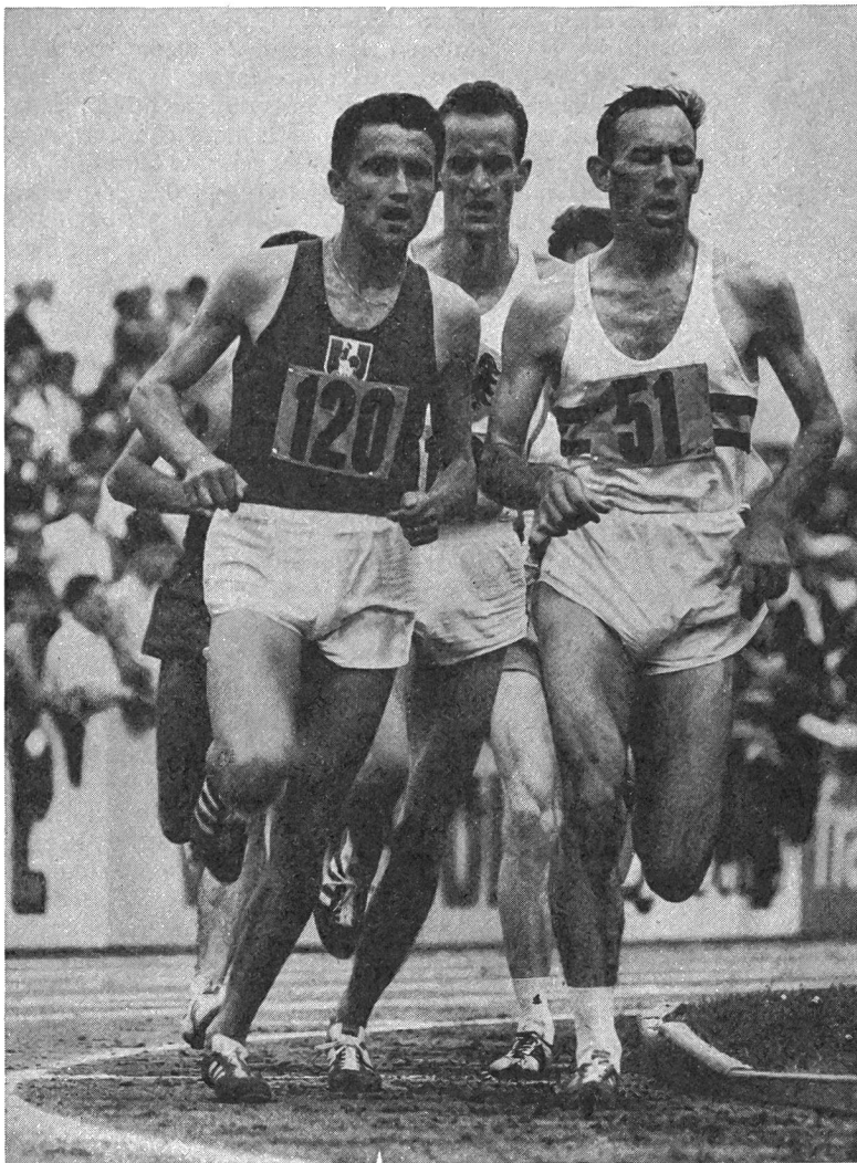
Michel Jazy n'a pas cherché à «durer» outre mesure.