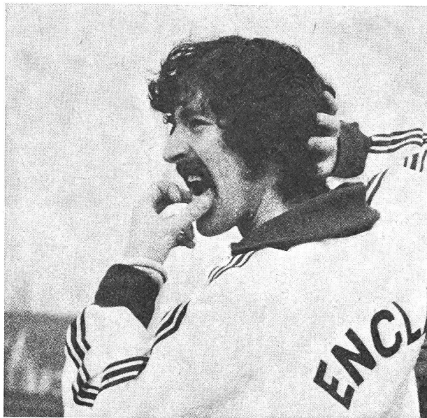
Bedford: Toujours surclassé dans les courses tactiques.