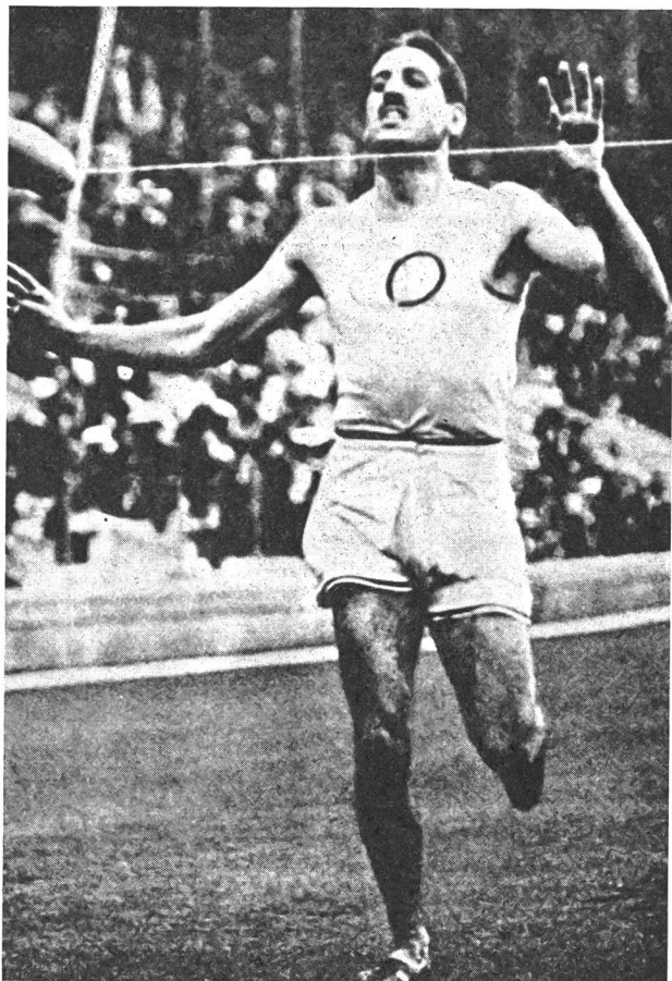
Comment réagirait Jean Bouin s'il était de retour parmi nous?