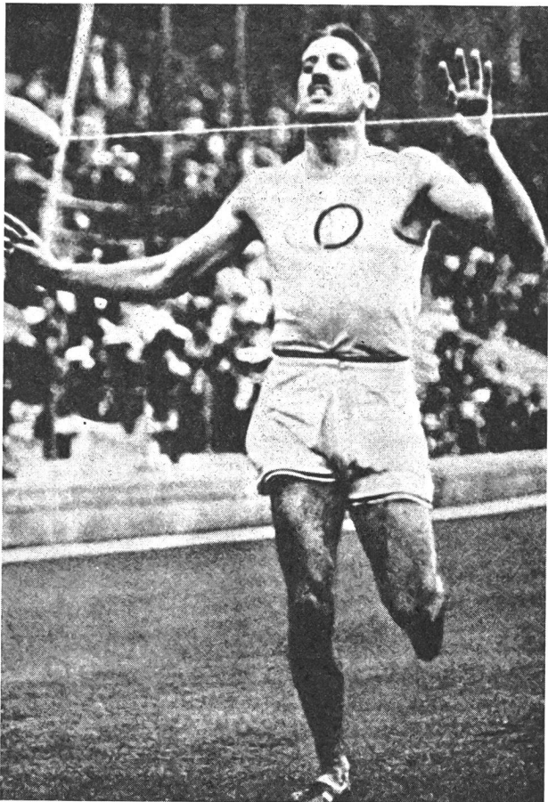
Comment réagirait Jean Bouin s'il était de retour parmi nous?