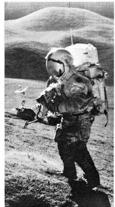
145 0022 - Seamaster, Speedmaster professional, remontage manuel, étanche.