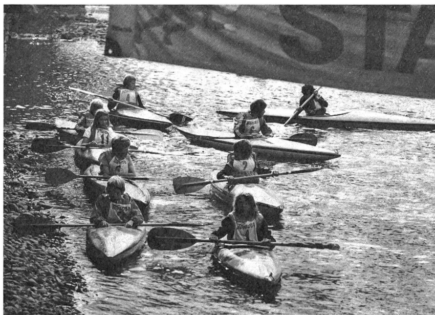
La concentration avant le départ

Photos et texte: Hugo Lörtscher EFGS Macolin