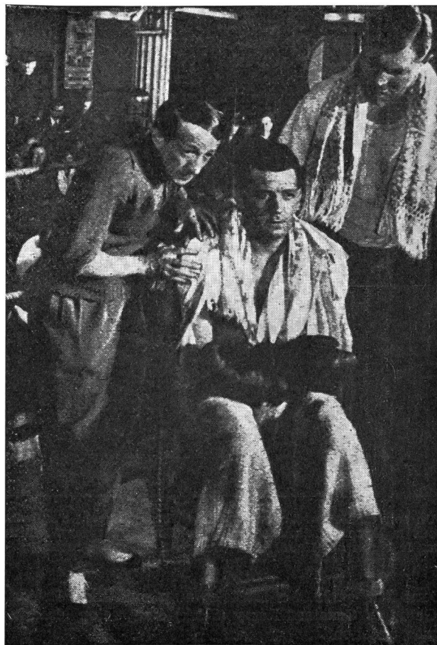
«Un soir de Rafle»: un bon film!

Dans ses mémoires, Georges Carpentier évoque ce film en ces termes: C'est l'histoire d'un ancien champion de boxe tombé dans la débîne, qui «remet ça», se fait battre, et que la fille qu'il aime abandonne pour un imprésario douteux. Un scénario qui n'était pas d'une originalité bouleversante, mais valait par les détails.