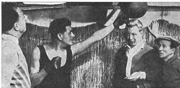
«Un soir de Rafle». Louis Georget (Albert Préjean) s'entraîne sous la direction de Charley Stick (Constant Rémy), admiré par le baron des Haudriettes (Lucien Baroux) à gauche.

Voilà, en vérité, un scénario bien conventionnel, mais à cette époque, le sentimentalisme était nettement plus puissant qu'aujourd'hui. Les metteurs en scène n'avaient pas pour principale motivation cet anticonformisme auquel, désormais, nous devons tant de films ineptes. Ils s'adressaient au peuple et non à de pseudo-initiés. On s'émouvait pour des histoires simples, et même banales; en tout cas fort proches de la vie: populistes, en un mot, ce populisme qui devait tout de même subjuguier des romanciers tels que Jean Prévost, Henri Troyat, Paul Vialar et Louis Guilloux. Aucun excès d'aucune sorte; aucun parti-pris de singularité. Après la projection, les spectateurs pouvaient rentrer chez eux rassérénés: certes, ils vivaient dans un monde difficile, mais au moins trois choses ne pouvaient qu'emporter l'adhésion des vieux et des jeunes: l'amour, l'amitié, et, cernant tout cela, une solidarité bien robuste. De tels sentiments triomphaient de toutes les avanies de l'existence! Même dans les films sportifs, où la raison du plus fort n'était pas toujours la meilleure si l'amour n'intervenait pas!