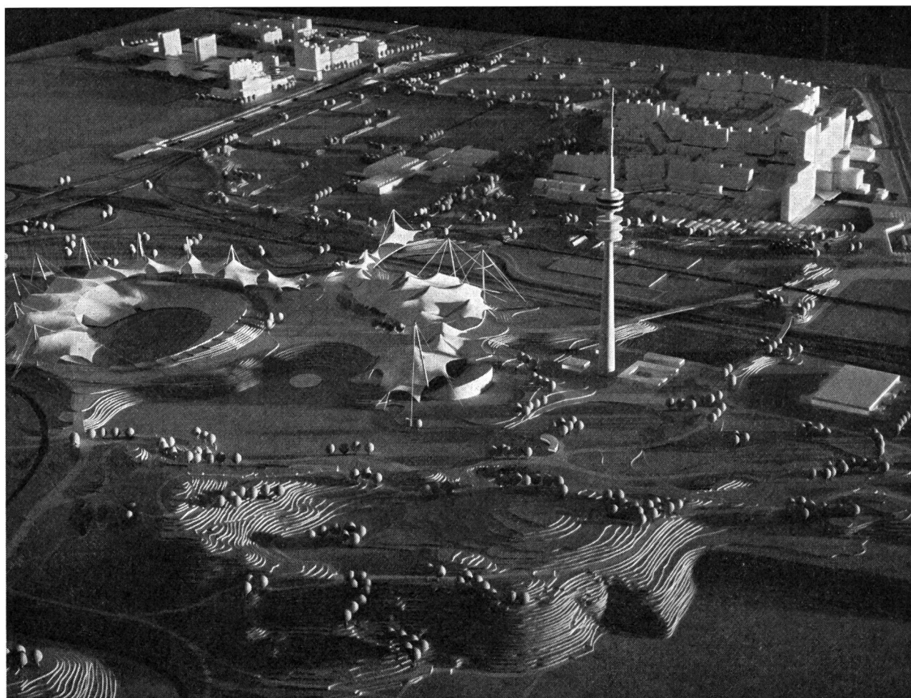
L'Oberwiesenfeld lorsqu'il sera terminé: — au fond à droite: le village olympique; — A droite: la Tour Olympique;