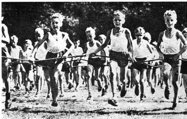
Une joie à l'éducation physique collective et «alignée» que nous acceptons difficilement, en Suisse, mais qui porte ses fruits en Allemagne de l'Est.

L'athlétisme: course, saut, lancer, représentant le mode d'expression le plus naturel, il était normal qu'il fût immédiatement considéré comme le sport de formation et de préparation par excellence et qu'il devint prioritaire.