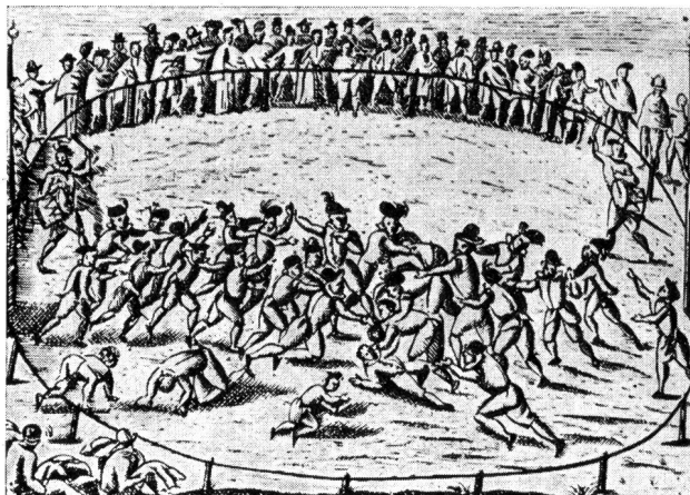
Cette illustration est tirée de l'ouvrage d'Antonio Scaino sur le «Gioco del Calcio», datant de 1555. On remarquera, en particulier, les deux tambours, aux extrémités du terrain, dont la mission était d'encourager les joueurs.

déjà en Chine, il y a près de 2500 ans où on le connaissait sous le nom de «Ts'uhküh». On peut en suivre la trace à travers le Japon, l'Empire romain, à travers le Moyen Age et la Renaissance où Antonio Scaino, en 1555, «s'explique de façon approfondie sur le sport de la balle dans le premier manuel édité dans ce domaine. Il expose en détail les règles du «Calcio» où, déjà, on manipulait avec les mains et les pieds, un ballon préalablement gonflé. La place de jeux était si longue que même le lanceur le plus aguerri ne pouvait lancer une