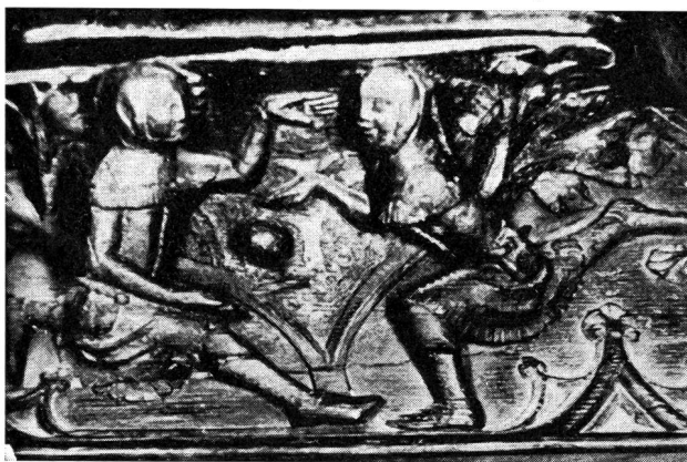
Bas-relief sur bois du 14e siècle qui se trouve dans la Cathédrale de Gloucester, en Angleterre, et qui est bien une des plus anciennes représentations du jeu de football.

A tout seigneur tout honneur. Le football est un sport roi et l'on comprend facilement qu'il ait le mieux servi les desseins des promoteurs de paris. «Il n'existe vraisemblablement aucun pays sur terre dans lequel le jeu du ballon ne s'exerce avec passion». Il se pratiquait