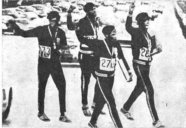
Des médailles qui donnent du poids aux poings levés contre certaines formes d'oppression politique.

comme moyen de propagande ou que, plus près de nous, lorsque Roger Bannister, après avoir couru pour la première fois dans l'histoire de l'athlétisme le mile en moins de quatre minutes, fut envoyé par son gouvernement en tournée «publicitaire» à travers les Etats-Unis; de même, enfin, lorsque les visas sont refusés aux sportifs qui désirent passer d'un bloc politique dans l'autre, que les deux Allemagnes refusent de lutter à l'ombre du même drapeau, que le poing des Noirs