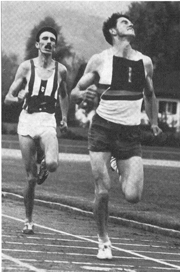
Etre fort pour être fort, c'est le contraire de l'acte utilitaire: c'est ce qu'on appelle le sport! Acte empreint d'une incessante volonté de dépassement.