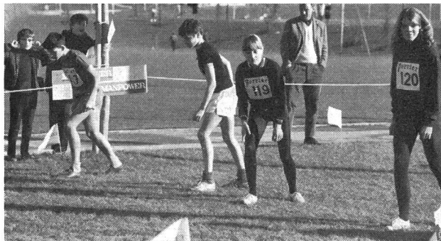
Départ d'une course à pied, catégorie écolier. Ils ne sont pas assez pour que filles et garçons partent séparément! Les autres? Où sont-ils?

faillance, l'Ecole a aussi pour mission de leur enseigner l'art de vivre en bonne harmonie avec ce corps qui est leur premier compagnon et avec lequel ils ne pourront jamais cesser de composer. Comme le grain de sable dans l'engrenage rend le machiniste nerveux, inquiet, et incertain, l'indisposition physiologique et le manque de maîtrise physique peuvent agir d'une façon décisive sur l'attitude de l'individu au sein du groupe dont il devient, dès son entrée dans la vie publique, une cellule agissante. Faut-il rappeler, ici, les résultats