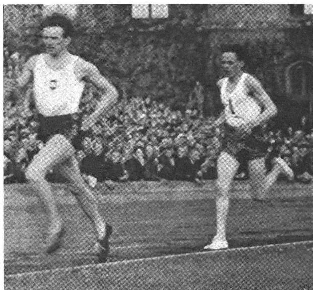
Les deux Suédois Arne Andersson et Gunder Hägg: toute une époque de l'athlétisme.

Bodo Tümmeler (Allemagne). La parfaite morphologie du coureur de 1500 m.