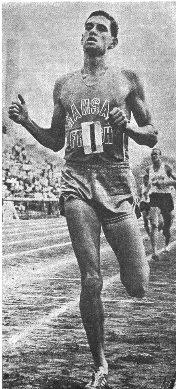
Jim Ryun: 3'33"1 sur 1500 m

Le 1500 m aussi bien que le mile représentent deux des distances les plus passionnantes de l'athlétisme. Avec le 800 m nous avons pénétré dans les premiers contreforts d'un pays mystérieux qui laissait présager l'existence de richesses particulièrement intéressantes. Nous sommes arrivés maintenant en plein cœur d'un monde nouveau dont le trésor est la résistance. Ici bien plus que sur 800 m encore, la vitesse et l'endurance ne suffisent plus à assurer le succès. Ces qualités doivent exister, certes, mais pour appuyer la résistance, cette sorte d'élasticité musculaire et de limpidité circulatoire qui assurent le maintien d'un rythme effort élevé grâce à une épuration rapide et parfaite du sang, polué par les déchets de combustion d'oxygène.