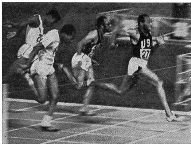
100 m: finale entre Noirs. Jim Hines gagne en 9,9 (RM égalé) devant Lennox Miller (Jamaïque) et Charlie Green.