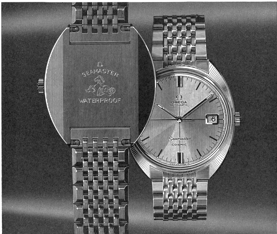
La Seamaster Cosmic: Etanche, calendrier, remontage automatique ou manuel Omega-Seamaster Cosmic: Wasserdicht, Kalender, automatisch oder mit Handaufzug

Son boîtier étanche — d'une seule pièce — la protège des chocs, de la poussière et de l'eau.