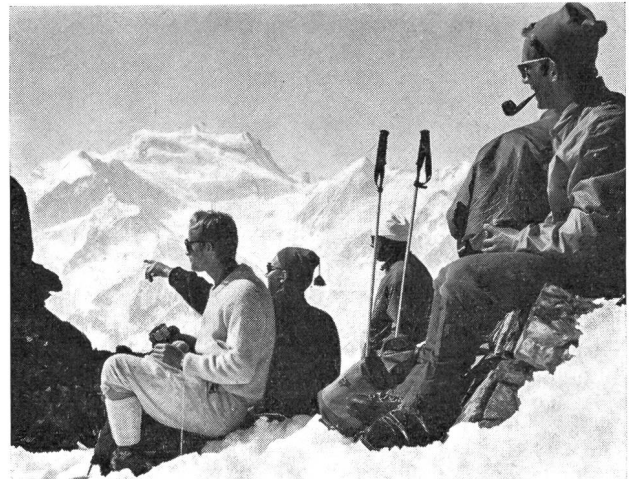
En face du Grand Combin.