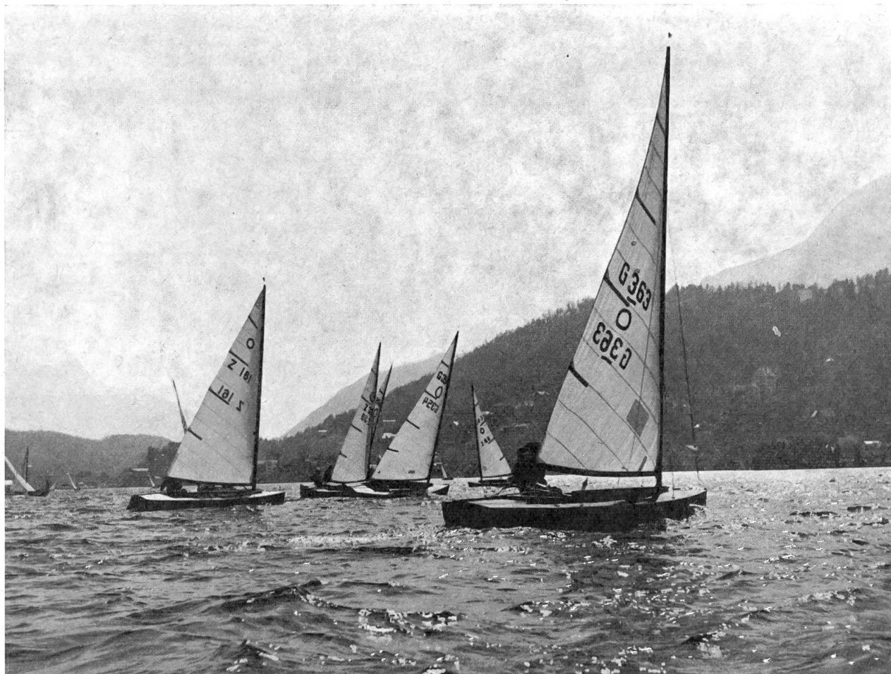
Sur le lac de St-Moritz.