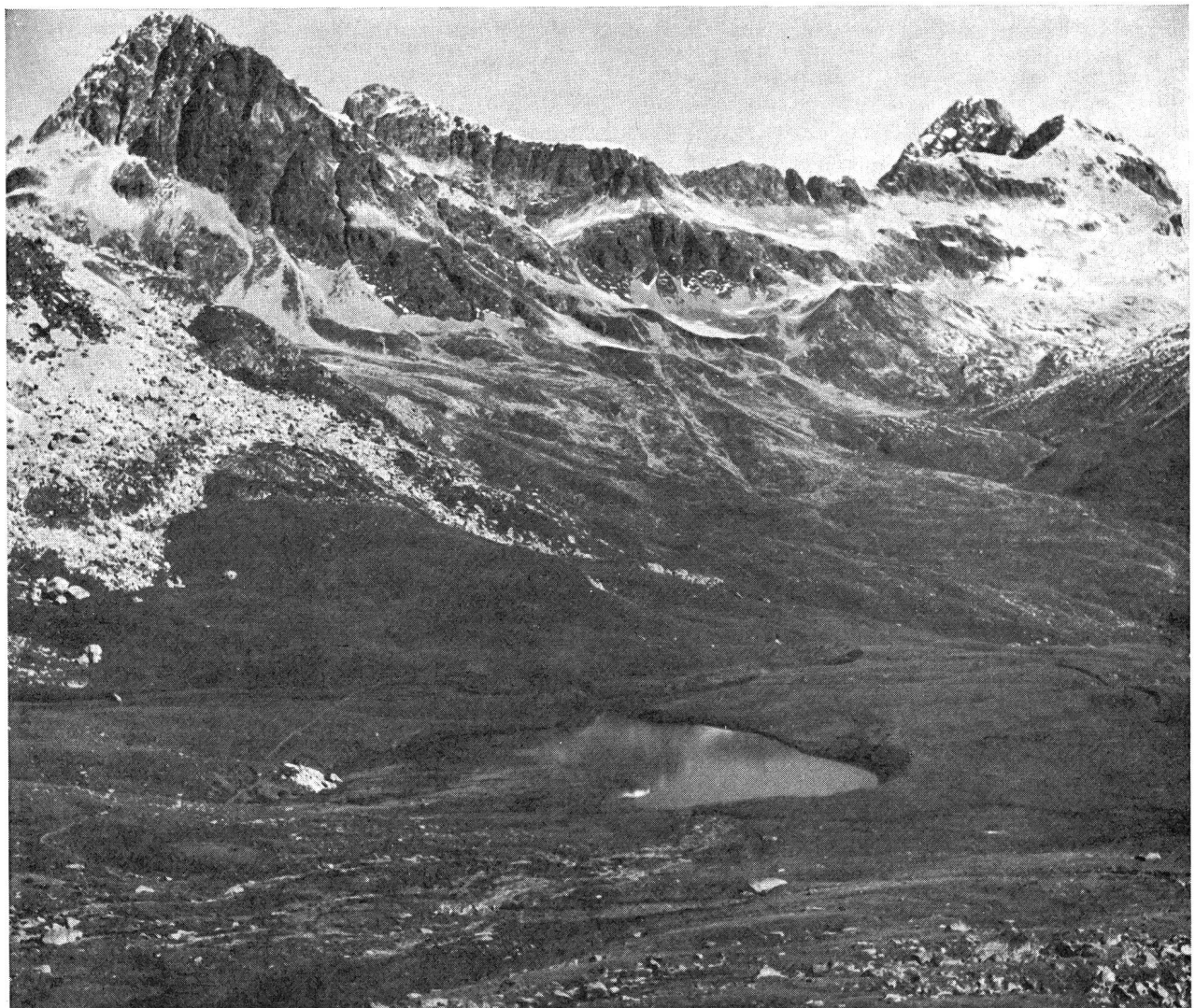
La piste finlandaise, au pied du Piz Nair, altitude: 2500 m.

S'il est vrai que le climat de très haute altitude peut avoir, à la longue, des effets fâcheux sur certains organismes, il n'en reste pas moins qu'il constitue, dans la grande majorité des cas, un milieu particulièrement