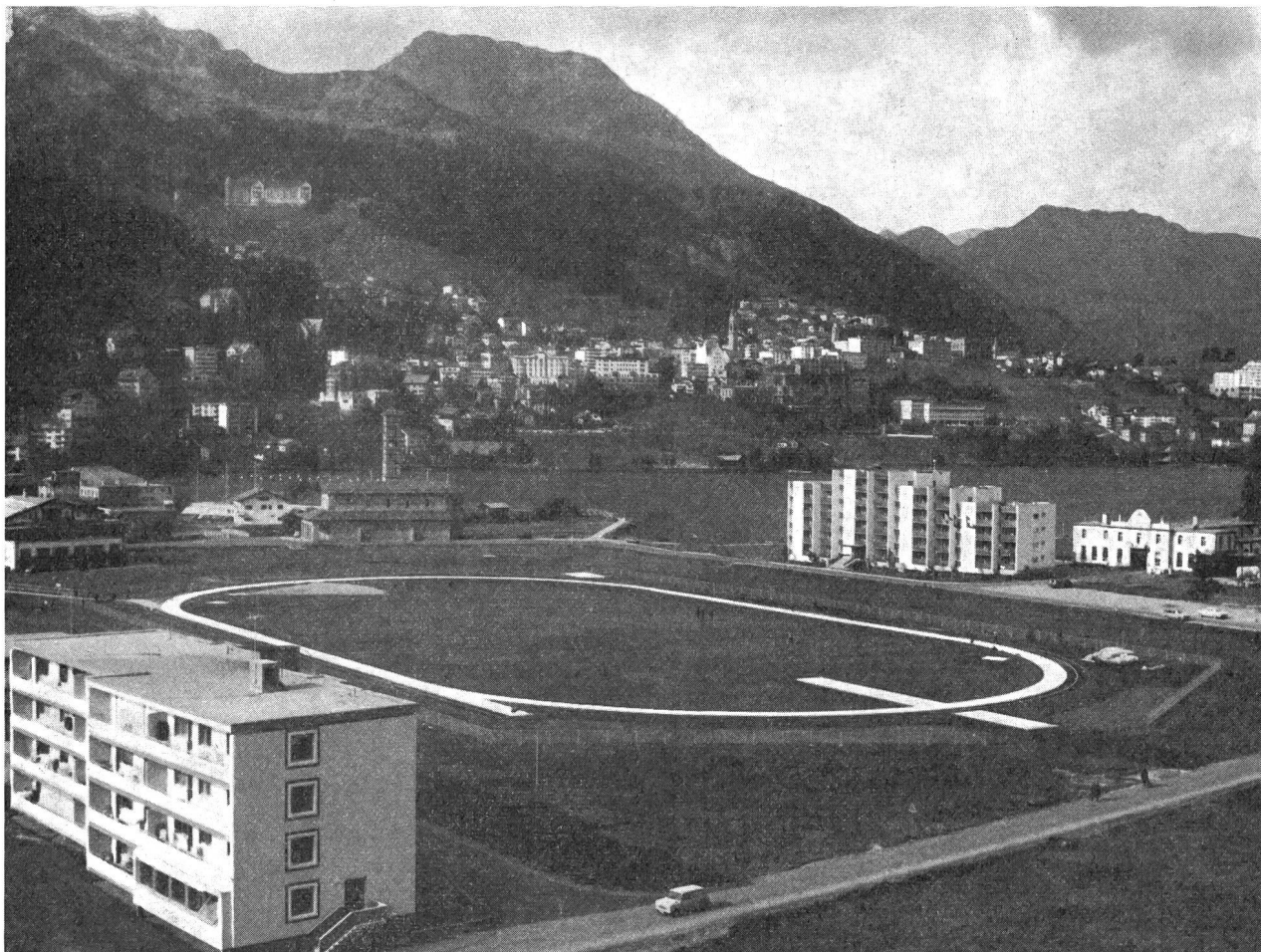
Les installations d'athlétisme, à St-Moritz, altitude: 1772 m.

Cet énorme ensemble venait d'être terminé lorsque je l'ai visité, et je dois dire que le gigantisme déployé m'avait fortement impressionné: une route d'accès comme une voie royale, un bouleversement de la nature qui donnait au paysage sauvage de cet endroit un visage bien différent de celui que je lui connaissais une année auparavant encore, un luxe et une perfec-