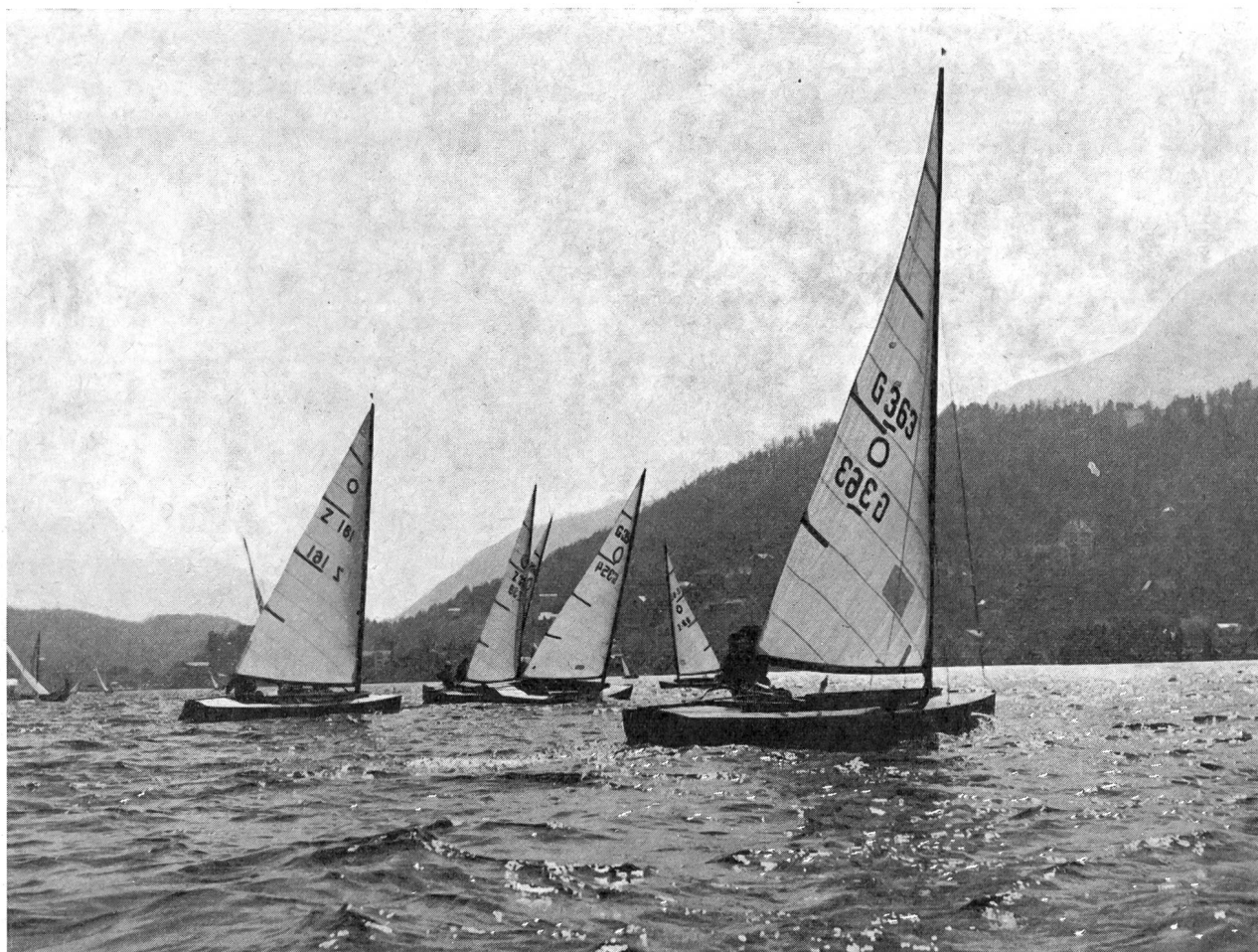
Sur le lac de St-Moritz.

Pour conclure, je ne peux m'empêcher d'adresser un profond merci à ceux qui ont eu l'idée d'organiser ce centre d'entraînement tout au service de la performance, du sport et de la santé publique. Merci aussi à Monsieur Kasper, président de la Société de développement de St-Moritz, qui m'a remis toute la documentation et donné les renseignements nécessaires à ce petit travail.