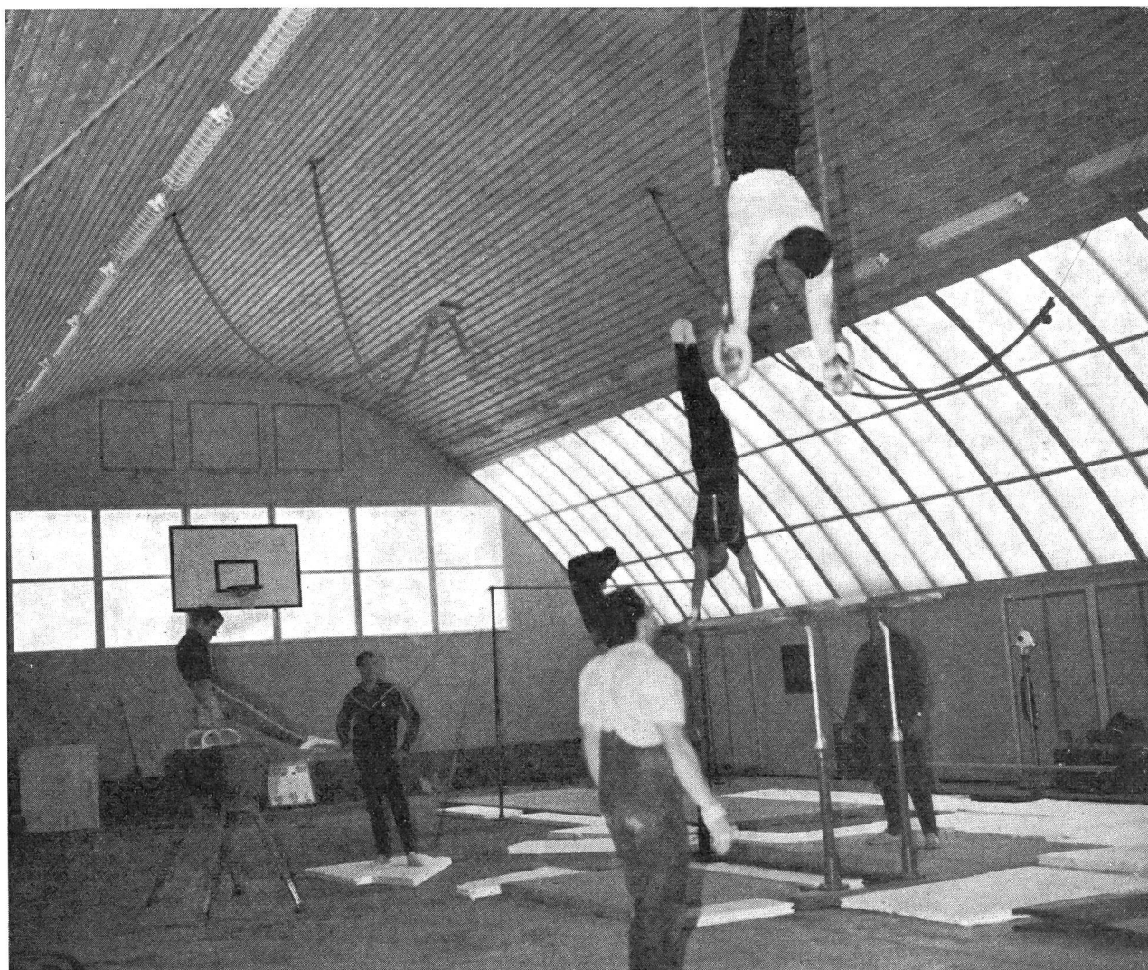
La salle de gymnastique la plus « haute » du monde, à Corviglia, altitude: 2488 m.