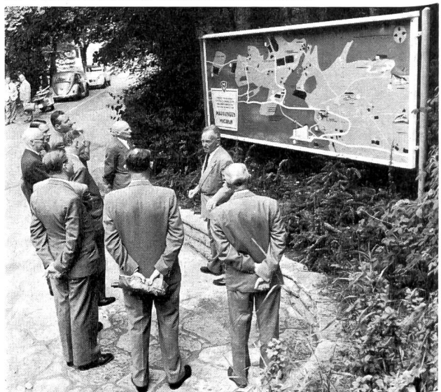
Le Conseil fédéral in corpore visite Macolin.