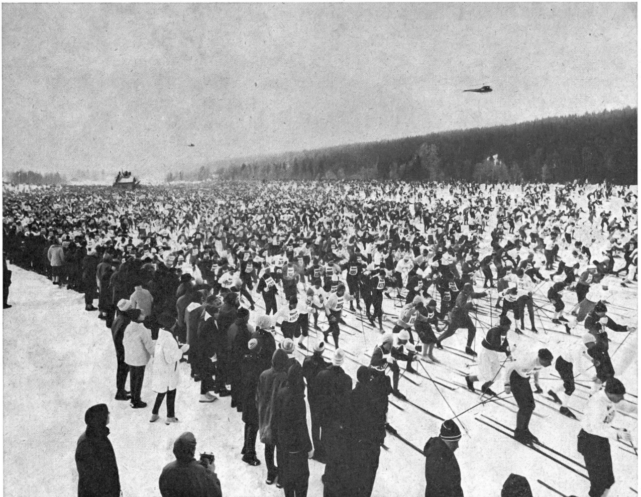
Départ de la course de Vasa (Suède). Verrons-nous un jour en Suisse semblable spectacle ?