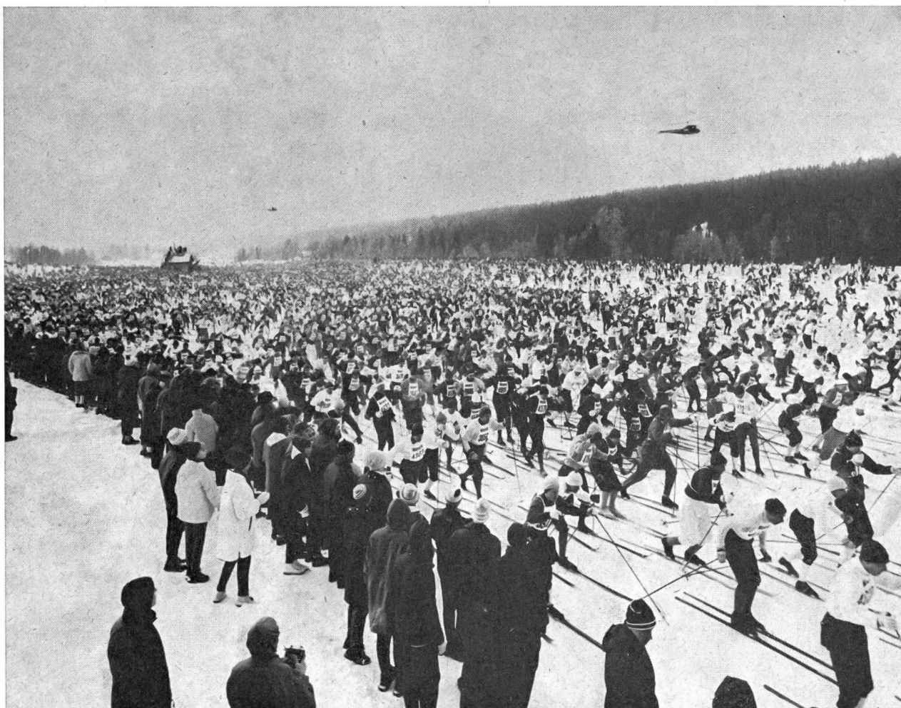
Départ de la course de Vasa (Suède). Verrons-nous un jour en Suisse semblable spectacle ?