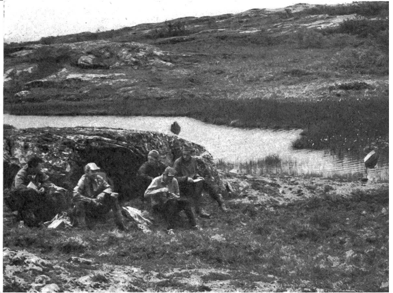
Figure 5 : Le traceur de piste, Lasse Larsson, un spécialiste de la course d'orientation de Fjäll, a établi le parcours de telle façon que le royaume de Norvège fût aussi touché.