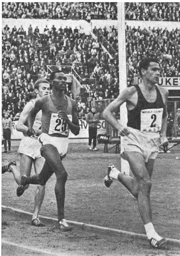
Le magnifique Keino (25), l'été dernier, dans le sillage du prestigieux Clarke.

Mais, d'ores et déjà, il nous paraît utile de faire connaître les principales conclusions qu'ont tirées Russes et Américains de leurs expériences en altitude :