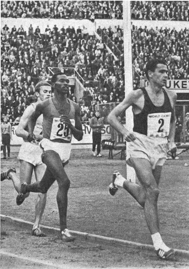
Le magnifique Keino (25), l'été dernier, dans le sillage du prestigieux Clarke.

Mais, d'ores et déjà, il nous paraît utile de faire connaître les principales conclusions qu'ont tirées Russes et Américains de leurs expériences en altitude :