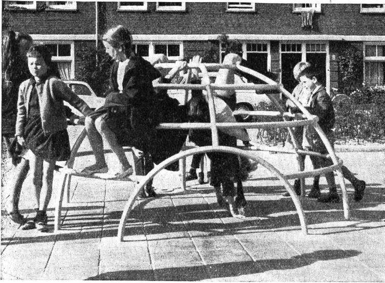
L'hémisphère à grimper est fort apprécié

« voituriers » attachaient leurs chevaux. Entre temps, ces « barres fixes » étaient utilisées, avec ardeur, comme agrès de gymnastique, par tous les enfants du quartier ! L'aspect des cours d'au-berges s'est complètement modifié avec la motorisation si bien qu'elles ne sont plus actuellement que des places de parc à auto-mobiles dans lesquelles les enfants n'ont plus rien à chercher. Ce petit exemple — un parmi bien d'autres — nous montre clairement la nécessité qu'il y a de doter nos enfants de places de jeux et d'agrès sur lesquels ils puissent s'ébattre, mesurer leurs forces et stimuler leur sens de la découverte. Les balançoires, glissoires ou autres agrès analogues sont des agrès qui incitent à une activité « passive » et sont, par conséquent, à déconseiller. Ils ont, peut-être, encore leur raison d'être sur une place de jeu pour tout petits, mais plus sur les emplacements destinés à la jeunesse scolaire.