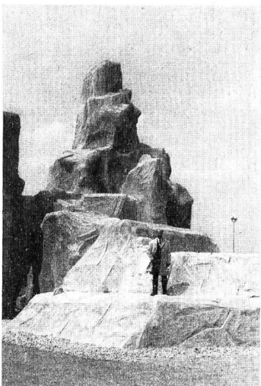
Le rocher de varappe en ciment : école d'alpinisme