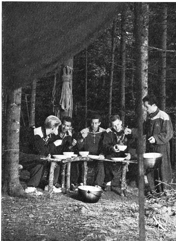
Candidats maîtres de sport au bivouac

Le diplôme de maîtres ou maîtresses de sport de l'Ecole fédérale de gymnastique et de sport est remis aux