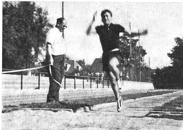
Monsieur Murier fut un expert très intéressé et actif si l'on en juge par ce document.