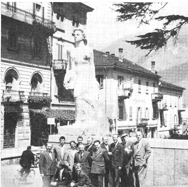
Les membres du S. R. I. réunis au pied du beau monument élevé à la mémoire du regretté Conseiller fédéral Giuseppe Motta.