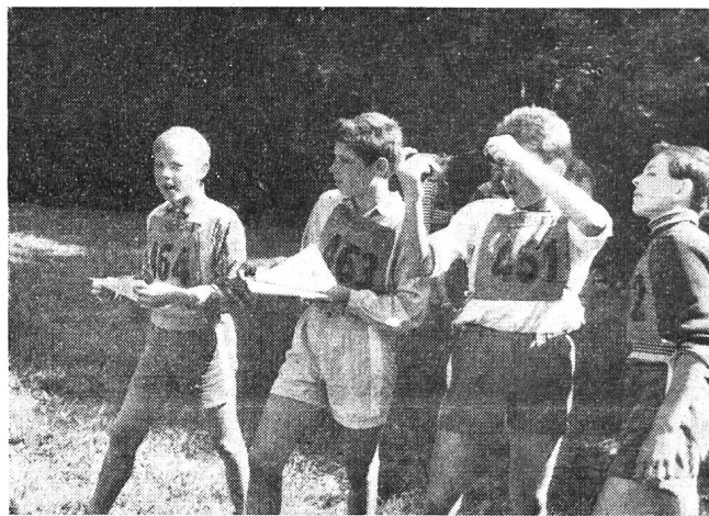
Les « chenillards » du Gr. E. P. Dombresson sont tout à leur affaire.

Cette année, les organisateurs — la commission cantonale E. P. — avaient imaginé toute une série de difficultés nouvelles. C'est ainsi qu'à un poste, les concurrents se trouvèrent devant des photographies aériennes de la région. Ils devaient alors relever sur leurs cartes, un point indiqué sur la photographie. Ailleurs, ils