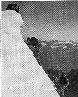
Les voici qui s'élèvent maintenant sur l'arête...