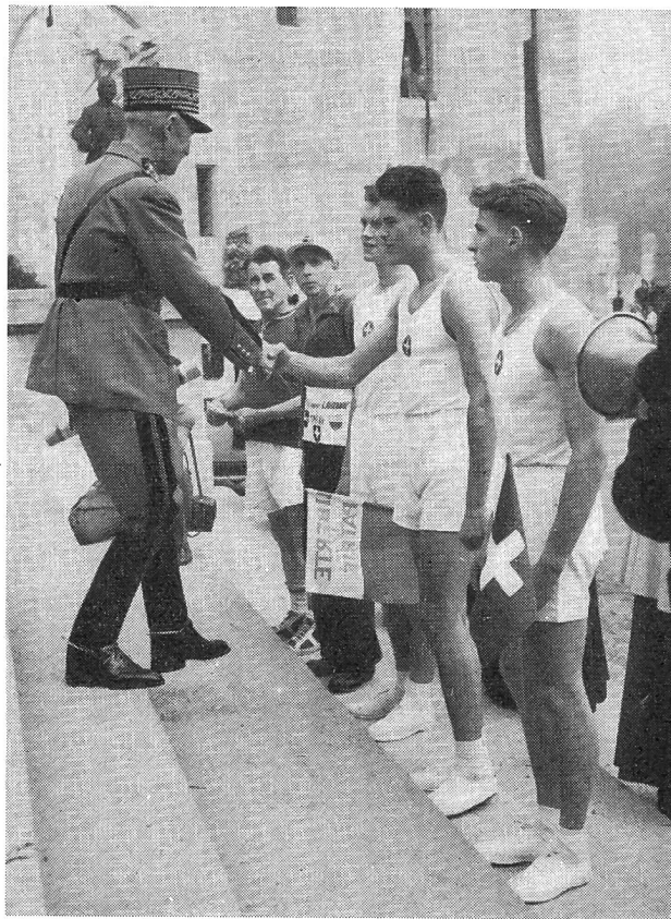
Le Général serre cordialement la main des trois jeunes gens qui viennent de lui remettre le message de la jeunesse suisse, avant de recevoir ceux des deux marcheurs Schmid et Frigério que l'on remarque à l'arrière plan.

side dans le vif intérêt avec lequel le Général s'occupe de tout ce qui a trait à la jeunesse. En toute occasion il a manifesté son amour de la jeu-