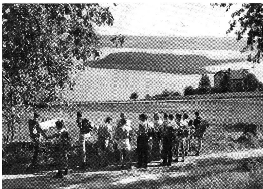
Va, découvre ton pays !