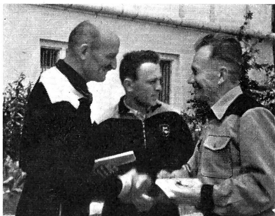
La chaude poignée de main du „patron” après le bref stage à Macolin !