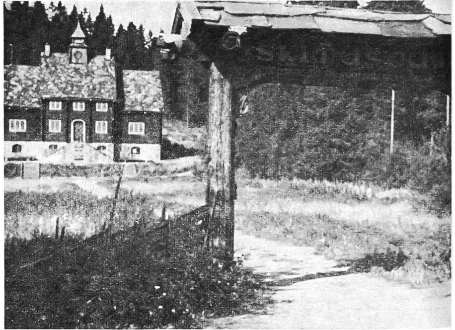
Le musée du ski à Holmenkollen

de nos vedettes, pour nous rendre compte de l'effort qu'il nous reste à faire dans ce domaine. Mais revenons à la Norvège ! A la distance d'un bon jet de pierre, en dessous de la station supérieure du chemin de fer de Holmenkollen, blotti au fond d'un valon, nous trouvons le musée du ski, admirable construction en vieux style norvégien. Le sous-sol renferme des douches, des vestiaires et un local sanitaire. Immédiatement devant le musée, encadrées de sapins, se trouvent les places de départ et l'arrivée des courses de fond de Holmenkollen (ce qui explique la présence des locaux du sous-sol du musée !)