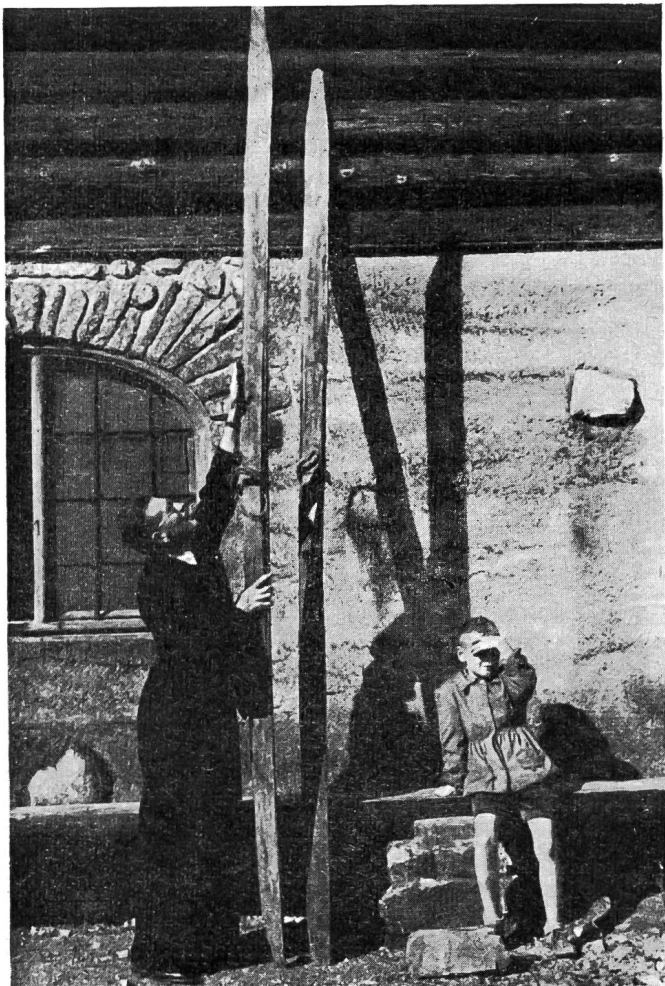
Le plus long ski du musée, 3 m. 67

A côté de ces skis géants, il y a encore un autre modèle de ski qui attire l'attention du visiteur. C'est un ski de grandeur normale dont la semelle est complètement recouverte d'une peau de phoque ou de renne. Intrigués, nous