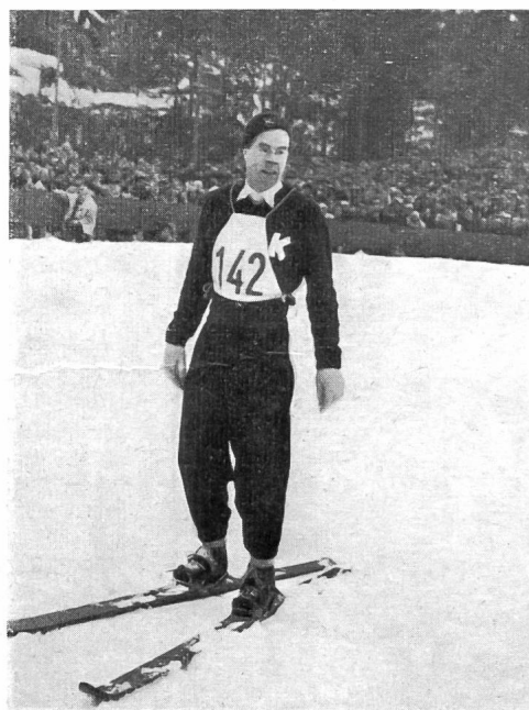
Asbjörn, le jeune champion de saut.

que des 18 et 50 km. à Chamonix, en 1924, J. Grøttmusbraaten, qui fut deuxième au classement des 18 km. à Chamonix, qui obtint quatre ans plus tard la médaille d'or à St-Moritz et qui gagna le combiné nordique aux championnats de la F. I. S. à Lahtis ; Lars Bergendhal, le champion du monde de Chamonix et le populaire Finlandais Pekka Niemi ; parmi les sauteurs, ceux également bien connus chez nous, tels Ole B. Andersen, Birger Ruud, Reidar Andersen, Sven Selanger et le jeune Asbjörn Ruud.