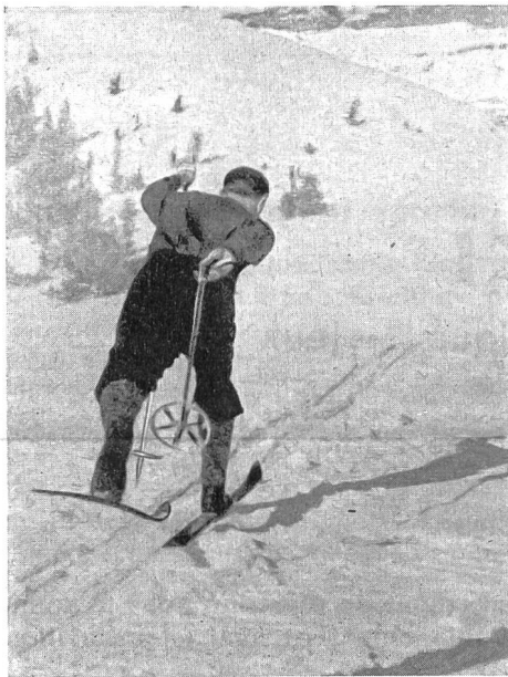
Poids du corps entièrement porté sur la jambe propulsive.

Travail méthodique : Débuter par la gymnastique sur skis. Puis, dans une neige conduisant bien, tracer soigneusement une piste assez longue. Sur un terrain légèrement en pente exercer ensuite le pas marché à la montée et le pas glissé à la descente. Nous devons exiger des débutants le strict minimum et ne pas les lasser en exagérant la répétition des exercices. Par contre, reprendre chaque jour le pas marché et le pas glissé, que nous exercerons également sans bâtons et sur un ski. Entre temps, alterner avec de petites promenades autour du terrain d'entraînement.