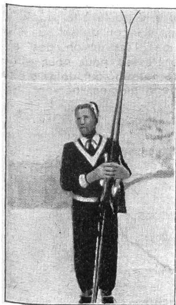
BIRGER RUUD champion olympique 1932

Nota : Chefs I. P. ! Ce numéro spécial de votre journal a été tiré en nombre d'exemplaires suffisant pour satisfaire les demandes qui vous parviendraient. Demandez-le à la rédaction et distribuez-le à vos élèves-skieurs qui le méritent.