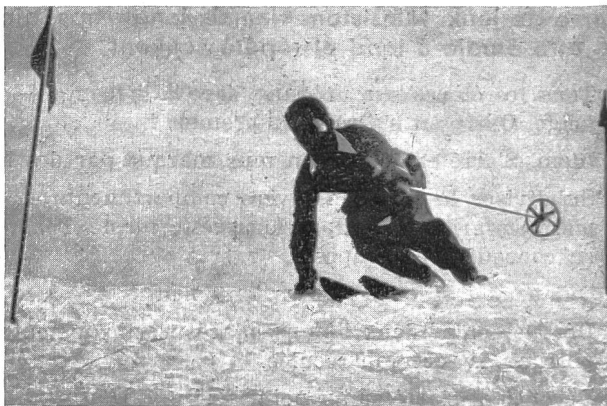
Plongée avec rotation dans le sens du virage.

Fin du mouvement : Ne pas exagérer le virage, reprendre la position de descente de biais en redressant le corps en avant en haut .