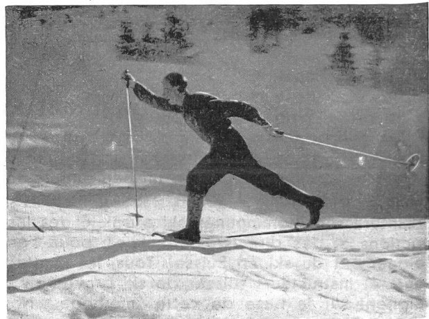
Extension vigoureuse d'un côté du corps.

Travail méthodique : Laisser à l'élève le soin d'exercer le pas de montée pendant l'enseigne-