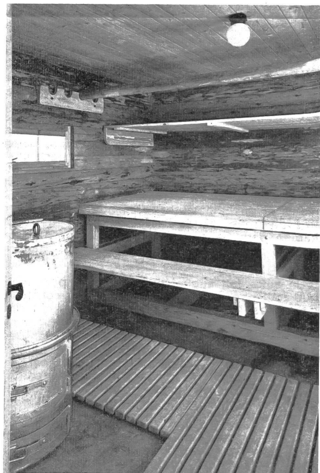
L'intérieur accueillant de la Sauna de Macolin

et tu transpires à un point inexprimable. Et c'est alors que tu sens un extraordinaire bien-être t'envahir ; l'euphorie la plus parfaite ; comme si tu sentais la fatigue te fuir par tous les pores de la peau. Après une demi-heure de ce régime, tu sau-