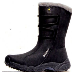
CORTINA BUGrip® Winter