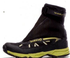
GG FLY BUGrip® Racing