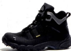
SPEED BUGrip® Active