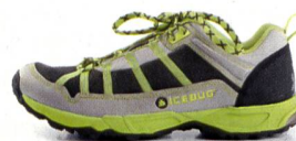
SISU OLX Racing