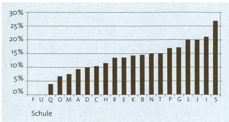
Abb. 3: Prozentsatz der Arztzeugnisse an den verschiedenen Schulen.

worden (s. Abb. 1). Aus dieser Analyse resultiert die relativ hohe Zahl an Absenzen über das gesamte Schuljahr: Eines von vier Zeugnissen betrifft Schülerinnen oder Schüler, die im betreffenden Jahr nicht an einer einzigen Sportstunde teilgenommen haben. Leider verhindert die fehlende Information über weitere Einzelheiten wie beispielsweise die Art der Beeinträchtigung oder die verordnete Therapie gezielte und aus didaktischer Sicht wertvolle Untersuchungen. Jedoch müssen das Arztgeheimnis und der Schutz der Privatsphäre gewahrt werden.