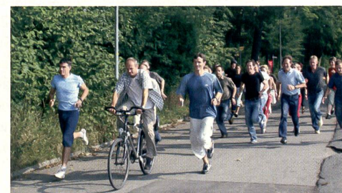
Grenzen erleben – kann ich eine kurze Strecke so schnell laufen wie der Marathonläufer über zwei Stunden?

Nicht zu kurz kam der Erfahrungsaustausch unter den Lehrenden. So wurde sicher gestellt, dass die Neuen den Weg zurück in die Schule fanden.