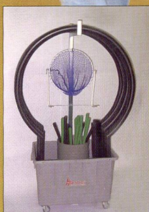
Platzsparende Transport- u. Aufbewahrungsmöglichkeit

...und im Internet !!! www.wiba-sport.ch e-mail: info@wiba-sport.ch