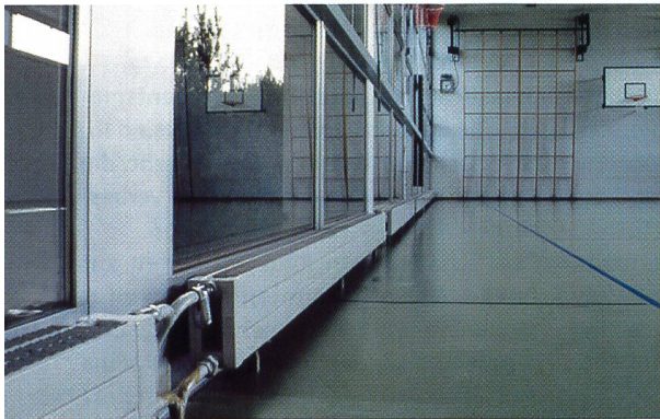
Gefahrenstelle unverkleidete Heizkörper.