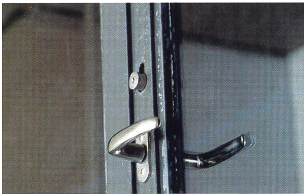
Gefahrenstelle vorstehender Türgriff.

Wie sicher sind die Sportanlagen in der Schweiz? Diese Frage kann nicht schlüssig beantwortet werden. Aufgrund der Statistiken und Erfahrungen beim Überprüfen von Sicherheitsaspekten bei Neubauten oder Sanierungen können die Spezialisten der Beratungsstelle für Unfallverhütung bfu aber bestätigen, dass die Sportanlagen «sicher nicht unsicher» sind.